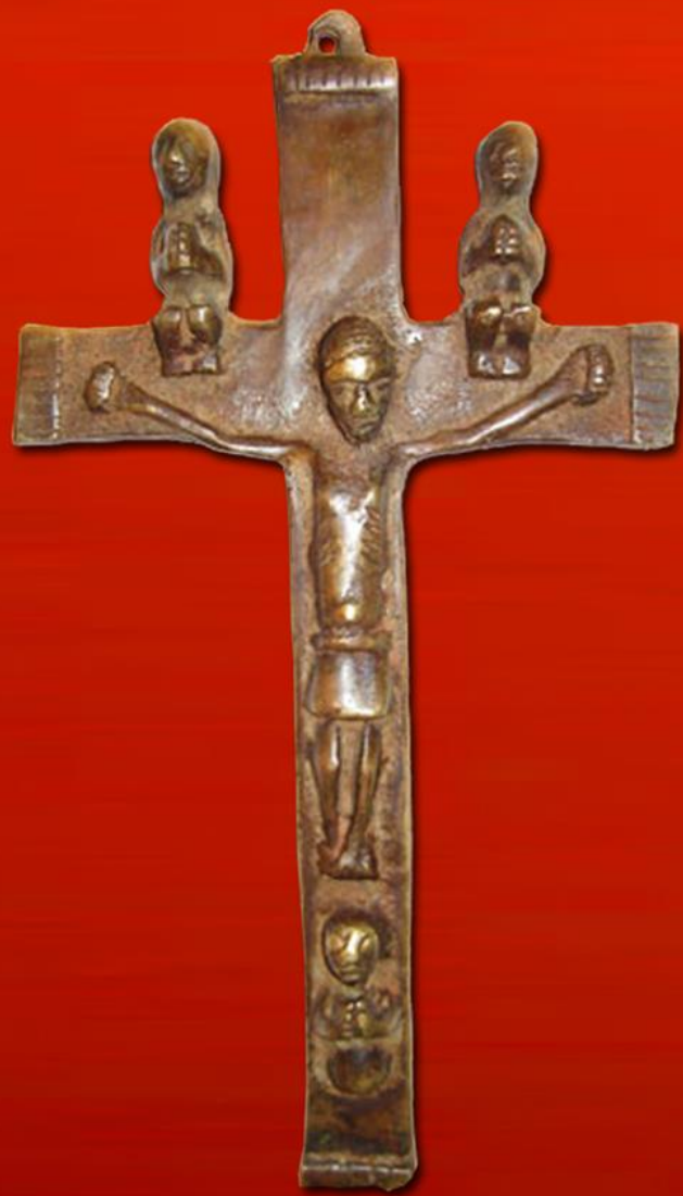
15th century crucifix from the Kingdom of Kongo